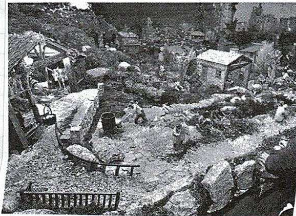
La Casa Museo de Víctor Corral y la laguna de la localidad, paradas obligatorias