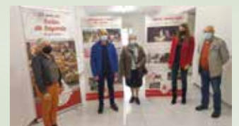
Casa da Cultura de Vilalba