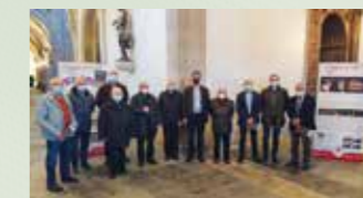
Na Catedral de Mondoñedo

CASTROVERDE, VILANOVA DE LOURENZÁ, VILALBA, FRIOL, A FONSGRADA, BALEIRA, OUTEIRO DE REI, RÁBADA, COSPEITO, MEIRA, A PASTORIZA, ABADÍN, XERMADE, CASTRO DE REI, GUITIRIZ, O CEBREIRO, TRIACASTELA, SAMOS, PARADELA, PORTOMARÍN, PALAS DE REI, SARRIA, MONTERROSO e GUNTÍN.