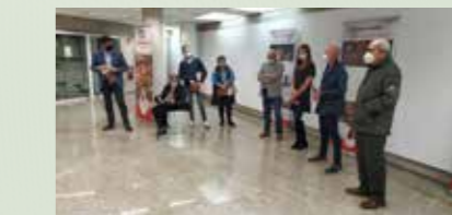
Sala de exposicións da Delegación Territorial da Xunta de Galicia en Lugo