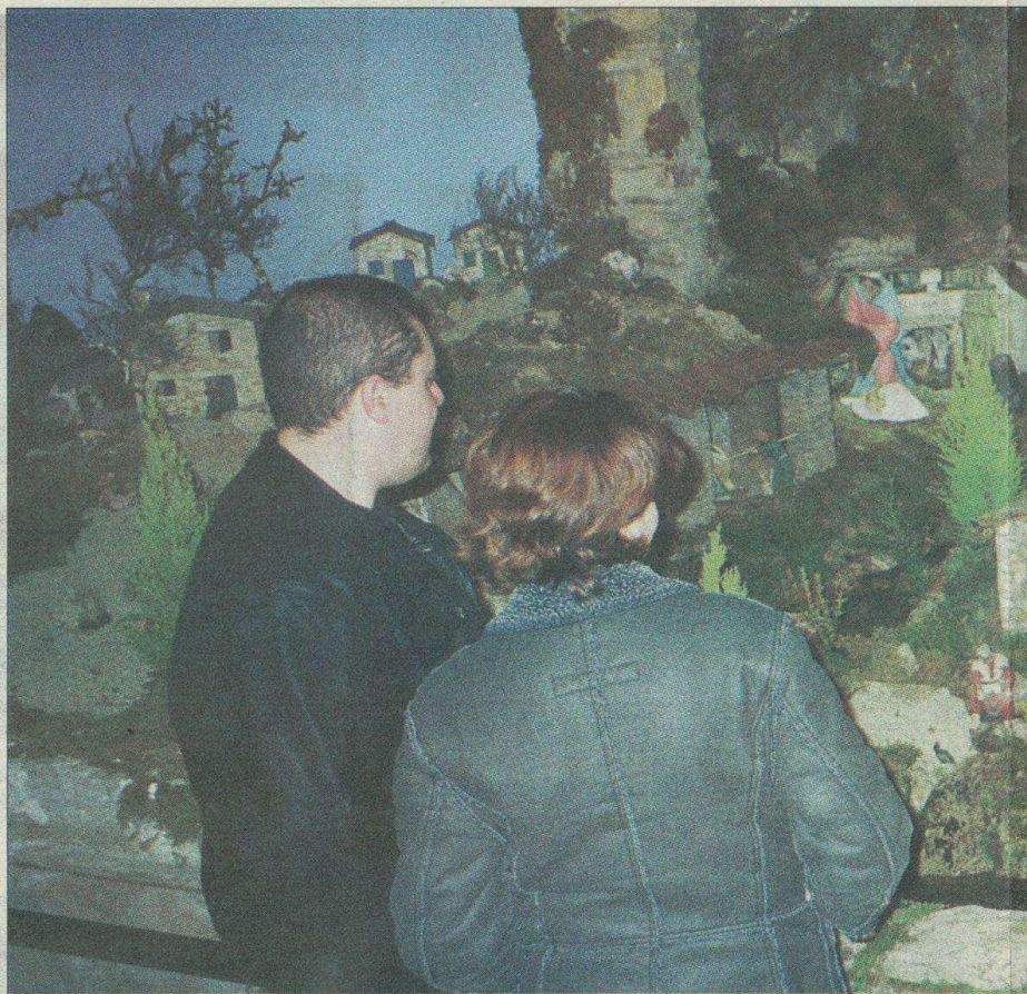
El belén electrónico de Begonte cuenta cada año

La apertura del belén se produjo este año el pasado 11 de diciembre, con la tradicional ceremonia litúrgica que contó con el acompañamiento musical de la coral polifónica de Ribadeo. El pregón se pronunció durante la misa y corrió a cargo del conselleiro de Educación e Ordenación Universitaria, el lucense Celso Currás. En su mensaje, Currás destacó la identificación de la localidad con la iniciativa. También apuntó que el belén contribuyó a la dinamización de Begonte.