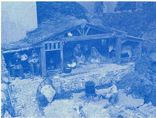
Portal do Belén de Begonte

Este primeiro ano sen el, o Belén non será tocado. Será o