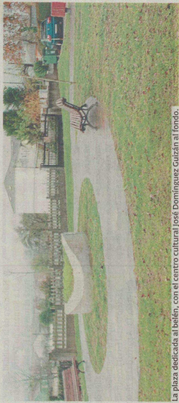
La plaza dedicada al belén, con el centro cultural José Domínguez Guizán al fondo.

Con las obras presentadas, que se pueden remitir hasta el día 25, se elaborará una exposición que podrá verse a partir del día 30 en la sala de exposiciones de la Xunta en Lugo y, a partir del 16 de enero, en la casa de cultura de Begonte.