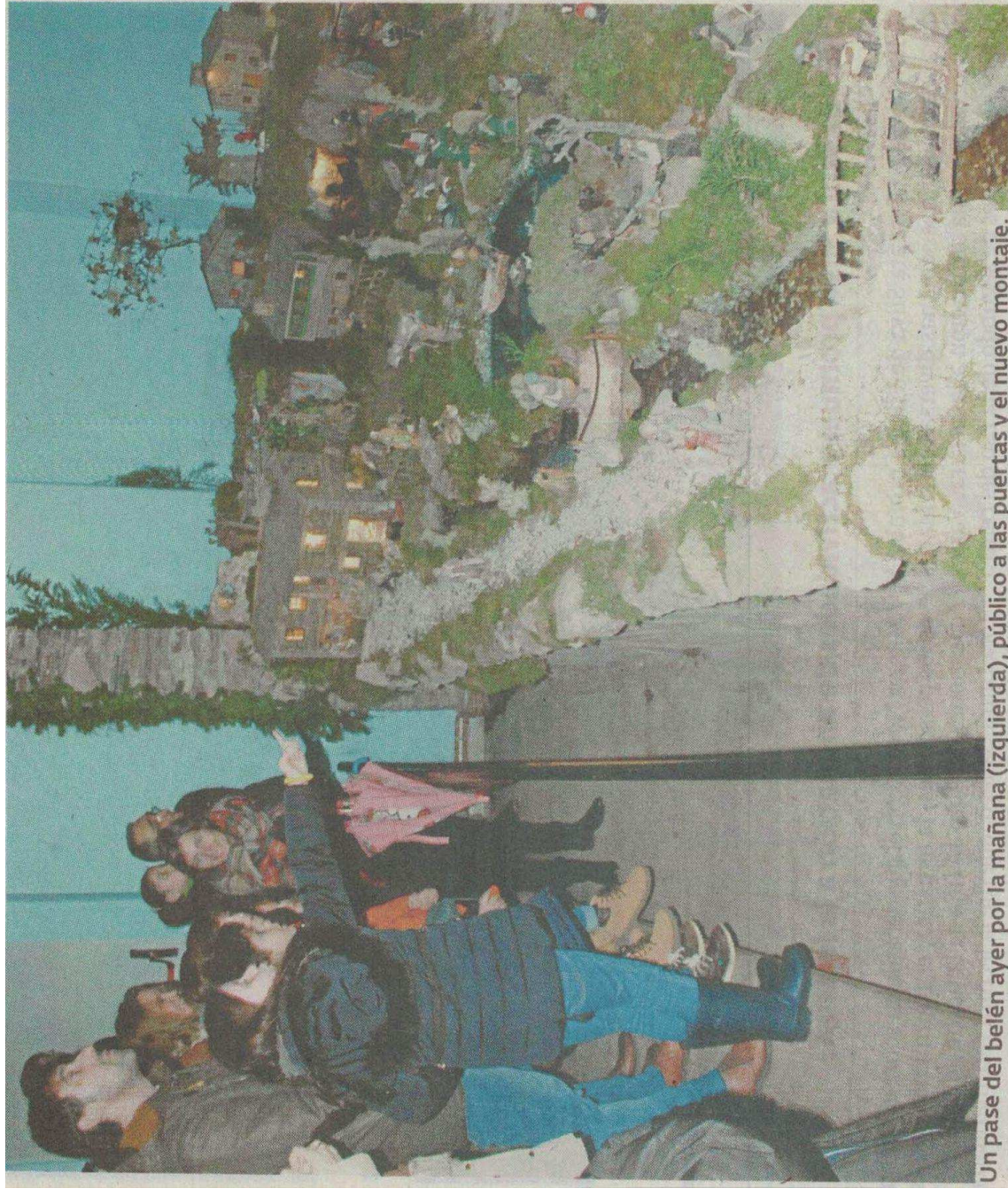
Un pase del belén ayer por la mañana (izquierda), público a las puertas y el nuevo montaje.