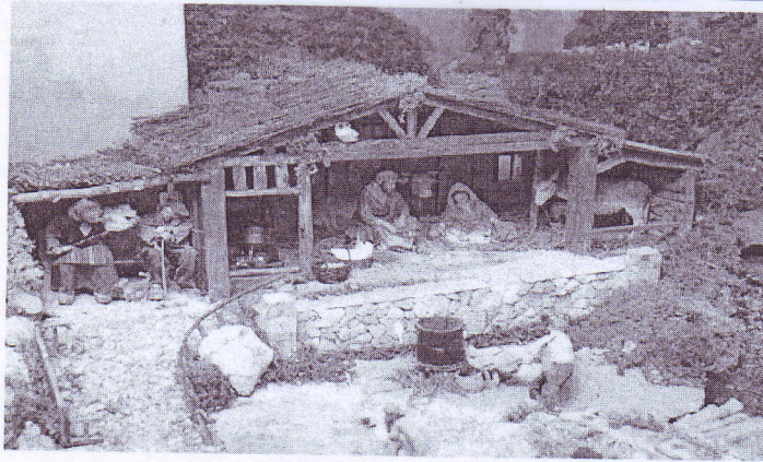
O misterio do Belén de Begonte

Trátase dun belén con oitenta figuras que se pode dicir que ten vida propia, no que as figuras están animadas electronicamente e, en conxunto, conforman unha escena de belén tradicional axeitado a Galicia de tal xeito que reproduce a vida de calquera parroquia da Terra Chá. Podemos dicir con propiedade, que este é un Belén que fai posible o diálogo fe-cultura, xa que é atractivo para os crentes e para os non crentes porque alí están presentes motivos relixiosos, motivos culturais, motivos etnográficos, motivos da cultura popular.