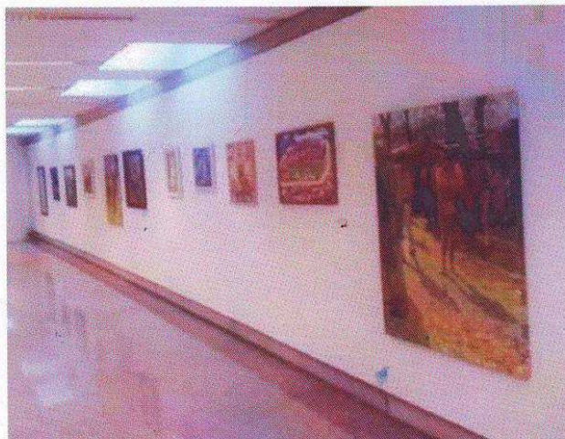
Imaxe na Casa da Cultura de Begonte da exposición

A Casa da Cultura de Begonte acolle dende hai uns días, unha exposición das obras que se presentaron á XXVI edición do Certame Galego de Arte "José Domínguez Guizán", convocado polo centro do mesmo nome,