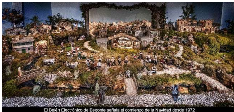
El Belén Electrónico de Begonte señala el comienzo de la Navidad desde 1972